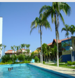
Foto da Pousada

Os aniversariantes (sócios) do 4º Trimestre (Out-Nov-Dez) - GRATUITOS.